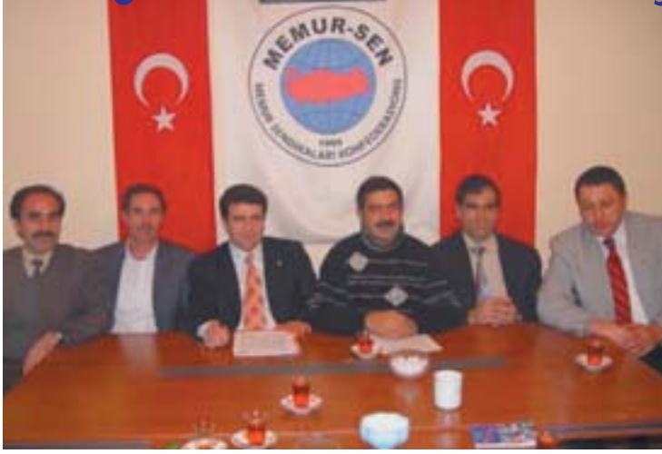
Görevde yükselme yönetmeliğini yayımlatmayı başaran Eğitim-Bir-Sen I ve Sağlık -Sen Erzurum şubeleri sendikal kazanımlarını ortak bir basın toplantısıyla açıkladılar.

E rzurum Atatürk Üniversitesi'nde çalışan genel idari hizmetler personelinin görevde yükselmelerine imkan sağlayan yönetmelik Eğitim-Bir-Sen ve Sağlık-Sen'in girişimleri sonucu yayımlandı.